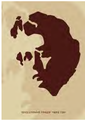
Stencil Cart Nr.: S2009

(ca. 1837– 1930) war eine bekannte US-amerikanische Gewerkschaftsaktivistin. Sie war vor allem bei den Knights of Labor, United Mine Workers und den Industrial Workers of the World aktiv. Sie setzte sich unermüdlich für die Rechte der Arbeiter_innen ein und wurde dadurch schon zu ihren Lebzeiten zur Legende.