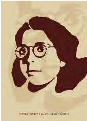
Stencil Cart Nr.: S2001

Format: Postkarte A6 | 10er-Pack | 9,- Euro