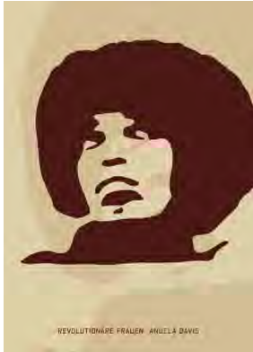
Stencil Cart Nr.: S2006

(1872 – 1952) war eine US-amerikanische Anarchistin, Gewerkschaftsaktivistin bei den Industrial Workers of the World und bekennende Lesbe. Sie war des Weiteren in ant imilitaristischen Kampagnen involviert und führte, da sie von Beruf Ärztin war, illegal Schwangerschaftsabbrüche durch.