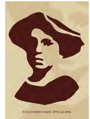
Stencil Cart Nr.: S2005

(1949–1919) war eine aus Russland stammende politische Aktivistin und radikale Intellektuelle. Ursprünglich von den russischen Nihilist_innen beeinflusst, verübte sie 1878 ein Attentat auf einen despotischen Polizeikommandanten und wurde zu einer einflussreichen marxistischen Autorin und Aktivistin.