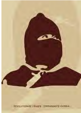
Stencil Cart Nr.: S2007

(*1944) ist eine Bürger_innenrechtsaktivistin, Philosophin, Schriftstellerin und Professorin an der University of California. In den 1960/70er Jahren war sie Mitglied bei Organisationen wie der Black Panther Party oder dem Student Nonviolent Coordinating Committee (SNCC). Sie ist Autorin zahlreicher Bücher zu radikaler Politik, Rassismus und Feminismus.