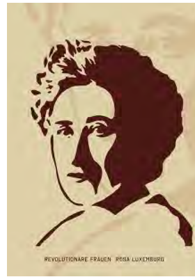
Stencil Cart Nr.: S2002

(ca. 1820 – 1913) ist eine der bekanntesten Aktivist_innen der „Underground Railroad“, ein geheimes Netzwerk von Routen, Zufluchtsorten und Fluchthelfer_innen, das von Gegner_innen der Sklaverei in den USA unterhalten wurde, um Sklav_innen zu befreien und in die sicheren Nordstaaten der USA zu bringen. Sie ist selbst als Sklavin aufgewachsen und war an unzähligen Befreiungsaktionen beteiligt.