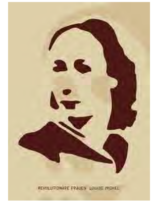
Stencil Cart Nr.: S2003

(1871– 1919) ist eine der bekanntesten Persönlichkeiten der deutschen sozialistischen Bewegung sowie der Antikriegsbewegung des Ersten Weltkriegs. Sie war Mitbegründerin des Spartakusbundes und der Kommunistischen Partei Deutschlands und wurde 1919 von rechtsradikalen Freikorps-Soldaten ermordet.