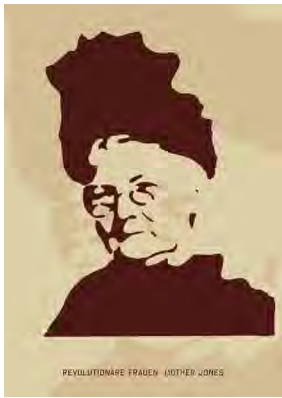
Stencil Cart Nr.: S2008