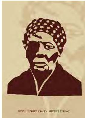
Stencil Cart Nr.: S2010

(1920 –1945) war eine niederländische Antifaschistin und aktiv im Widerstand gegen die Nazis. Sie verübte mehrere Anschläge auf die Wehrmacht und wurde so zu einer der meistgesuchten Widerstandskämpferinnen. Sie wurde nur drei Wochen vor der Befreiung der Niederlande von den Nazis verhaftet und erschossen.