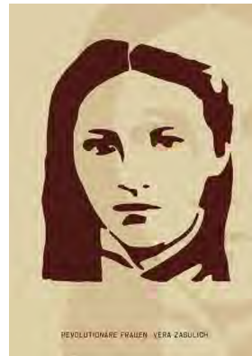
Stencil Cart Nr.: S2004

(1830 – 1905) war eine Anarchistin die vor allem für ihr Engagement in der Pariser Kommune bekannt ist. Nach der Niederschlagung der Kommune wurde sie in die Verbannung geschickt, kehrte aber 1880 wieder nach Frankreich zurück und war bis zu ihrem Tod eine treibende Kraft in der anarchistischen Bewegung.