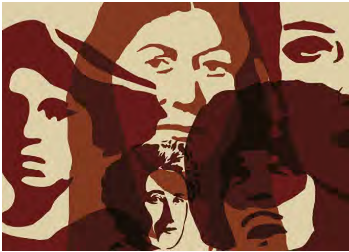
Stencil Cart Nr.: S2000